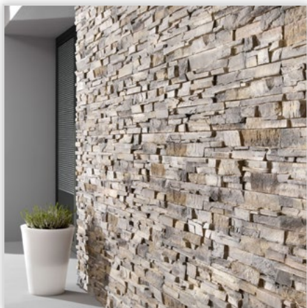
Kamień elewacyjny Grenada

Zastosowanie: na zewnątrz i wewnątrz. Kolorystyka: russet/frost/graphite.