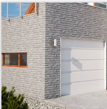
Kamień elewacyjny Amsterdam

Zastosowanie: na zewnątrz i wewnątrz. Kolorystyka: graphite.