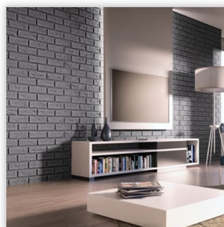
Płytką cegłopodobną Boston

Zastosowanie: na zewnątrz i wewnątrz. Kolorystyka: wood/beige/grey.