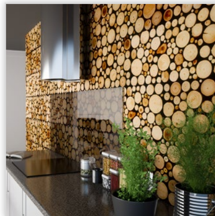
Panel drewniany Pure Wood Collection

Zastosowanie: wewnątrz. Kolorystyka: white/beige.