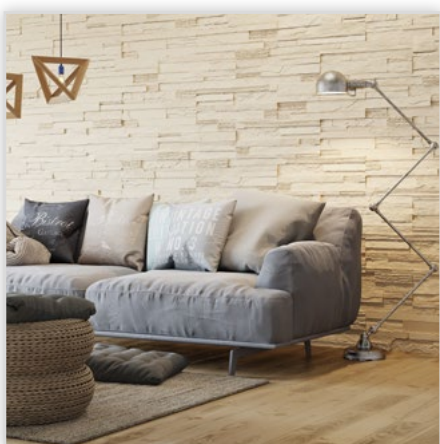
Kamień dekoracyjny Creta

Zastosowanie: na zewnątrz i wewnątrz. Kolorystyka: 540/548/568.