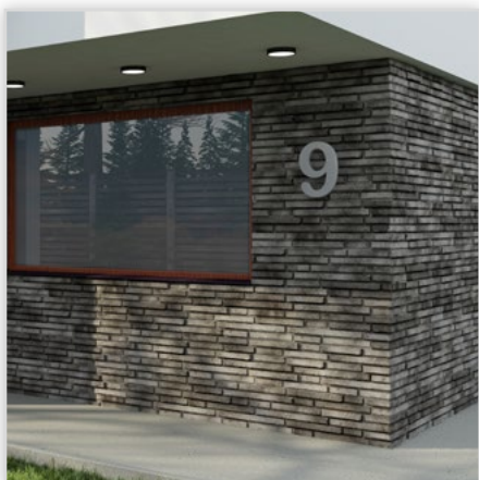
Płytką cegłopodobną z gotową fugą Dublin

Zastosowanie: na zewnątrz i wewnątrz. Kolorystyka: graphite.