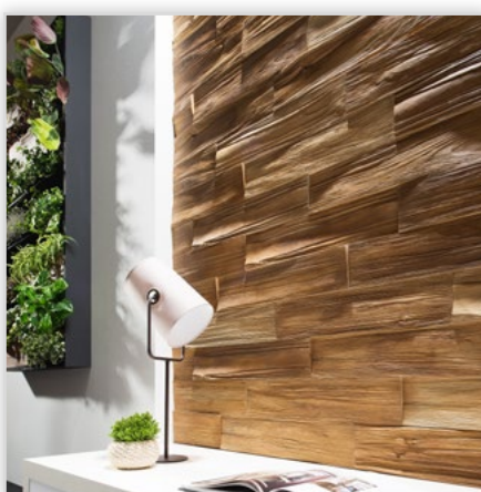
Kamień elewacyjny Timber

Zastosowanie: wewnątrz. Kolorystyka: cream/grey.