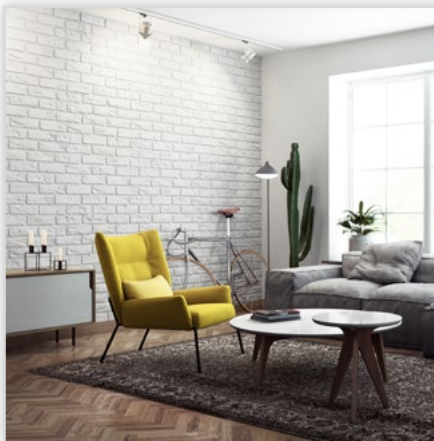
Płytką cegłopodobną Parma z gotową fugą

Zastosowanie: na zewnątrz i wewnątrz. Kolorystyka: russet/frost/graphite.